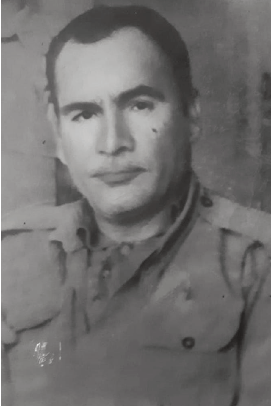
Gama ke Hêzê Bêtuwate de amirê batalyonî biyo (1974-75)