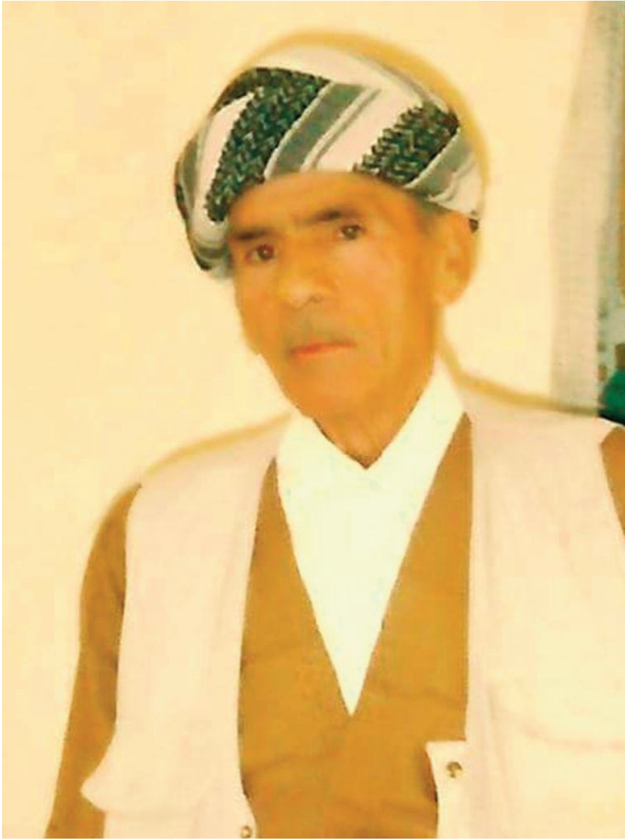
Serranê xwu yê peyînan de